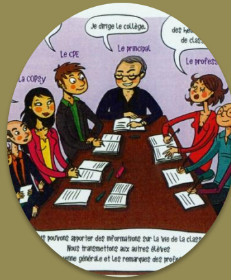
Conseil de la vie collégienne