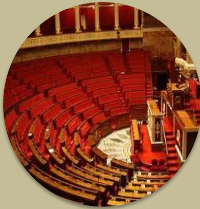
Assemblée des délégués